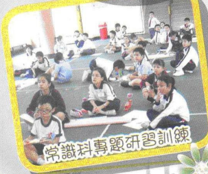
常識科專題研習訓練