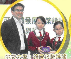
中文文學：餘屋及鄰論讀