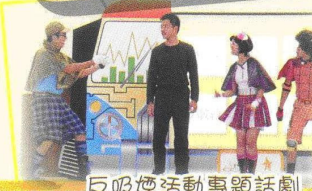
反吸煙活動專題話劇