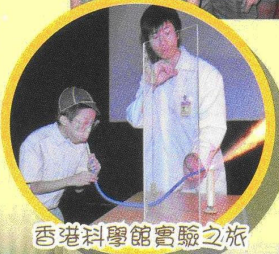
香港科學館實驗之旅