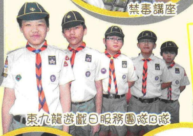
東九龍遊藝日服務團隊回隊