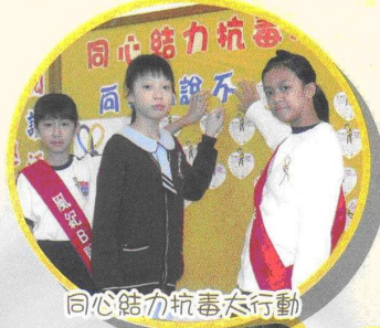
同心協力抗毒大行動