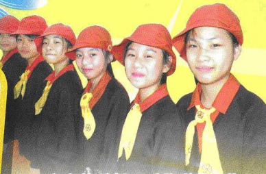
東九龍遊藝日服務隊團A隊