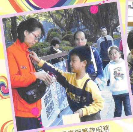
親子畫旗籌款服務