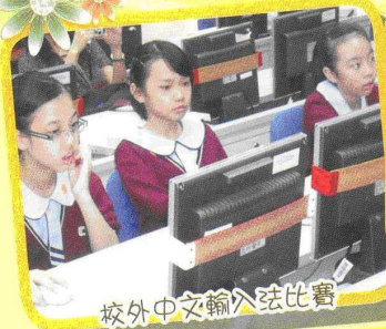
校外中文輸入法比賽