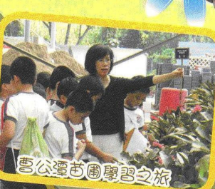
書公運苗圃學習之旅