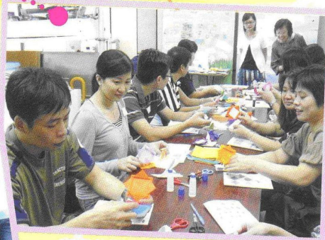
家長緣聚一刻：摺紙技巧訓練