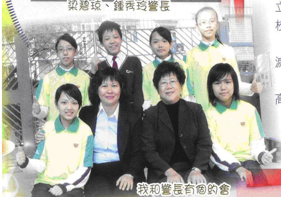
我和警長有個約會