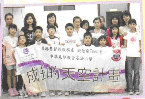
成長的天空親子黃昏營