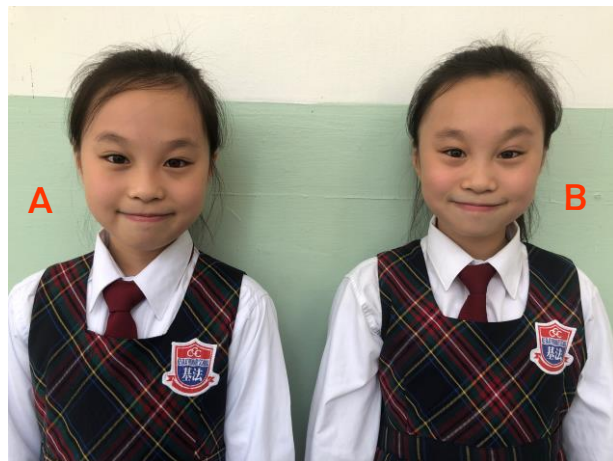
徐洛晴：( ) 徐洛琳：( )