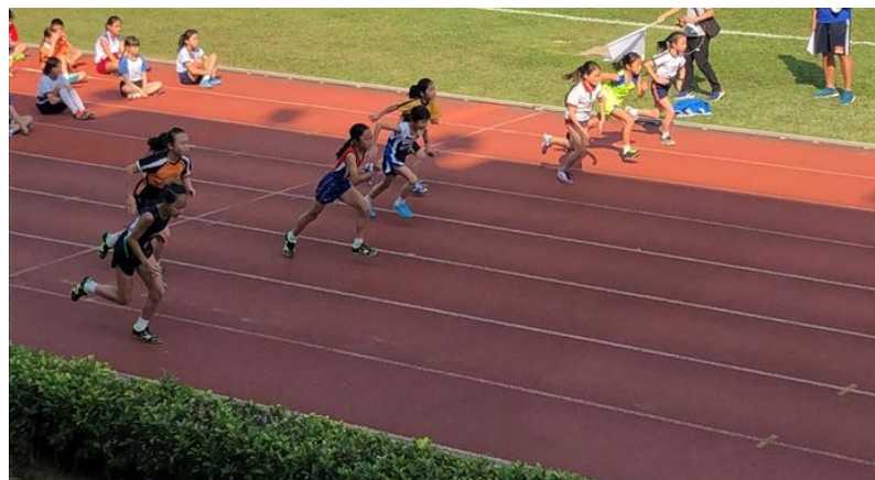
兩位短跑運動員進入了決賽