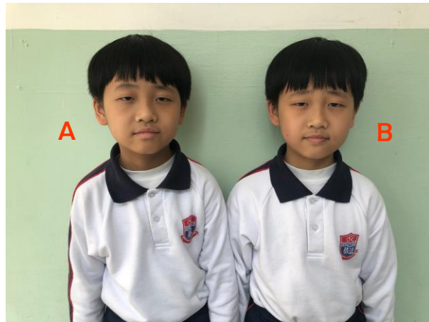
洪卓言：( ) 洪卓朗：( )