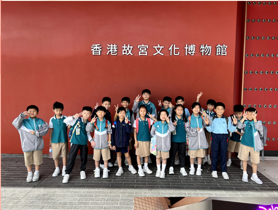
香港故宮文化博物館